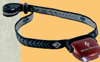
Frontale Black Diamond modello Ion