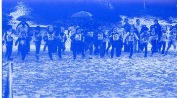
Partenza della gara categoria Cucciolo