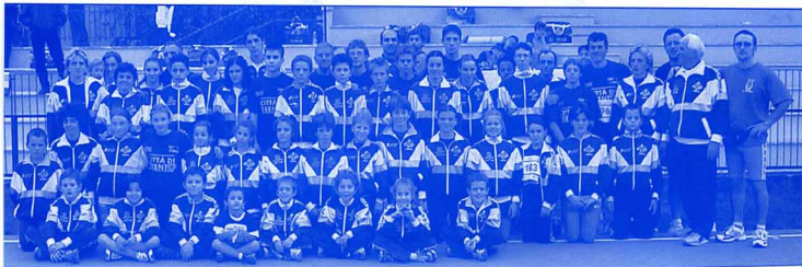
Gruppo atleti, dirigenti e tecnici in occasione della staffetta 100x1000